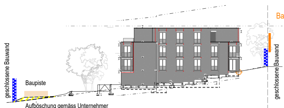
Ansicht NW - Haus A 1:500